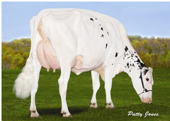
VELTHUIS SG SNOW EVENT FIFTH DAM