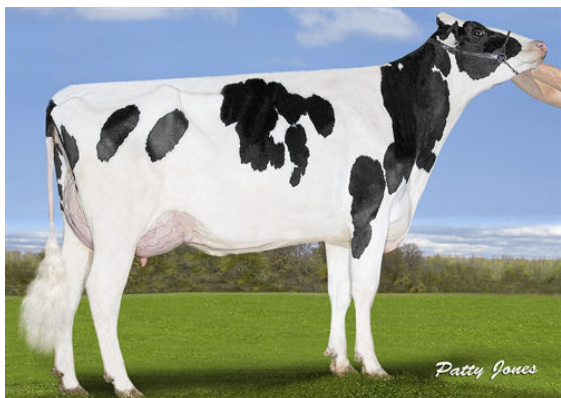
SILVERRIDGE DUKE ELSA-P GRANDDAM